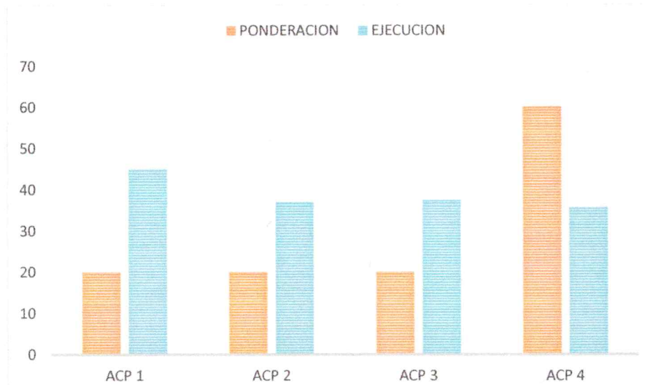
GRAFICO: 1 GRADO DE EFICACIA POR ACCIÓN DE CORTO PLAZO 2025 2DO. TRIMESTRE